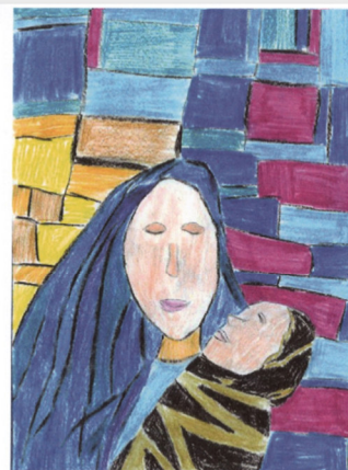
Monja Peschke, Kl. 7b

An die Schulgemeinschaft des BGB – Weihnachten 2021